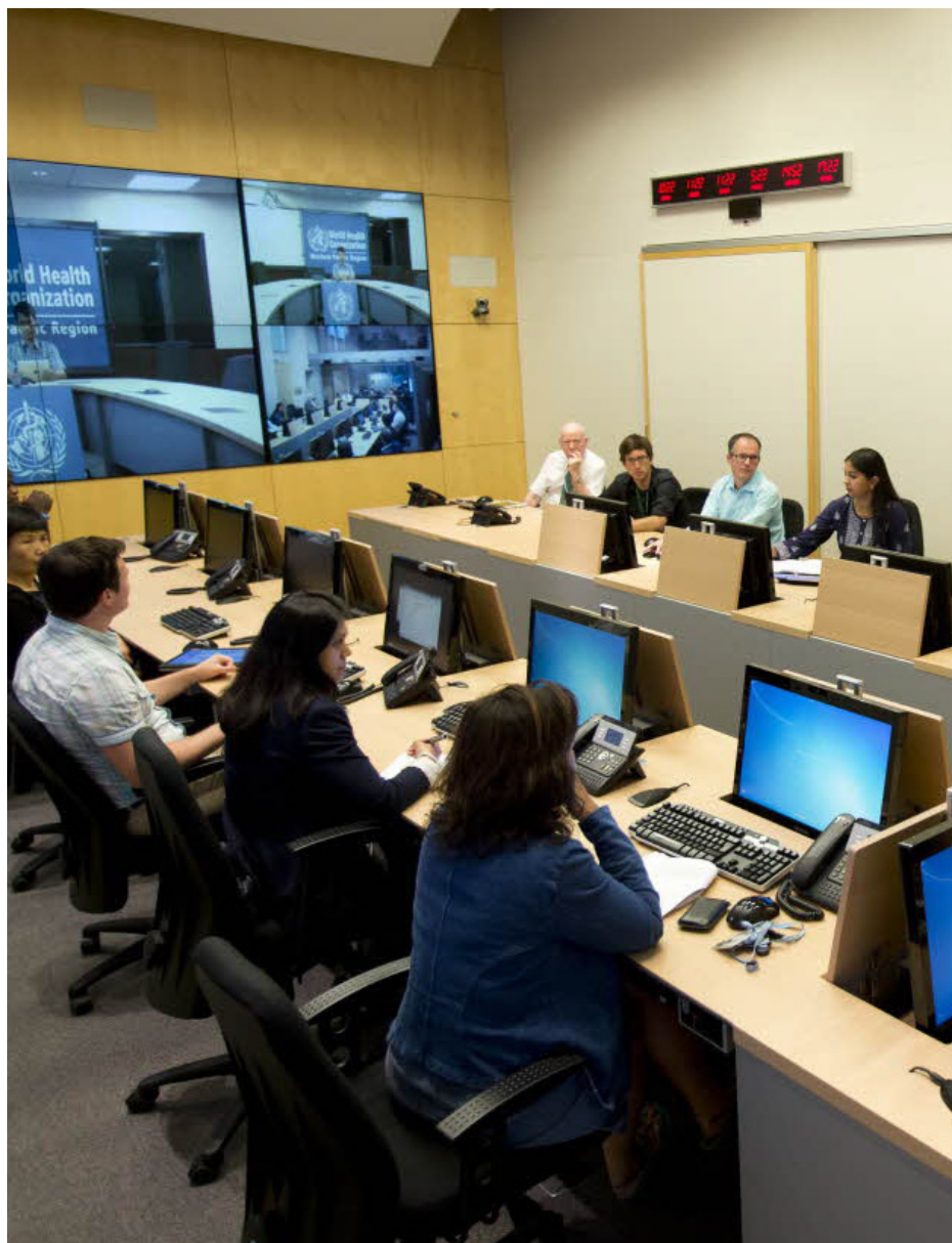
Centro Estratégico de Operaciones Sanitarias de la OMS (SHOC), 3 de mayo del 2009.