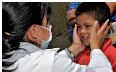
Brigadas de salud en Chiapas, México, durante la epidemia de gripe por A(H1N1), 2009.