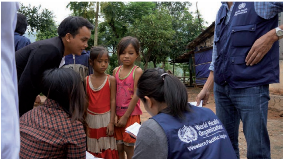
Funcionarios de inmunización de la OMS visitan la provincia de Quang Binh (Viet Nam) para monitorear la campaña de vacunación contra el sarampión y la rubéola.

Los mecanismos de gobernanza recomendados en la pauta 2 deberían asegurar que se especifiquen y sean transparentes aquellas