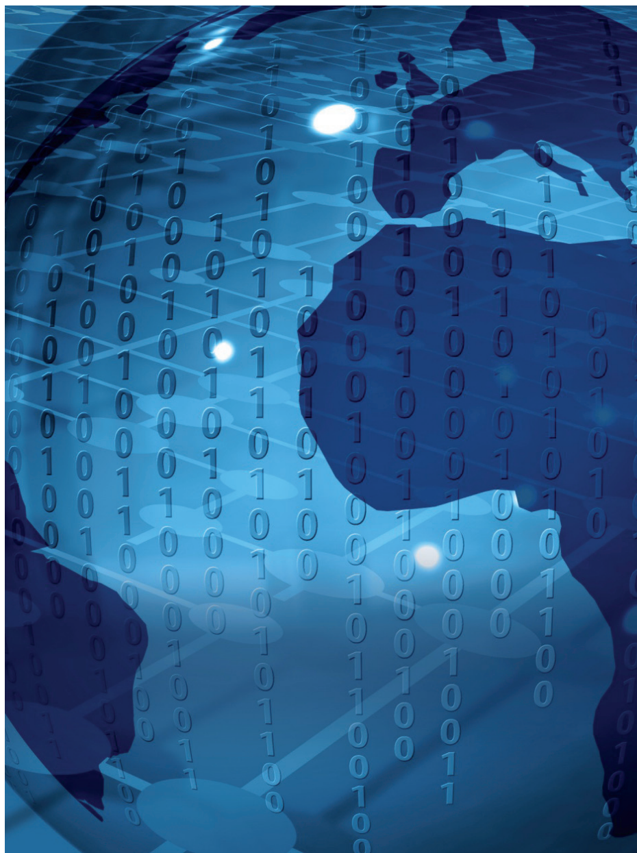
Globo terráqueo y continentes con el código binario cero-uno.