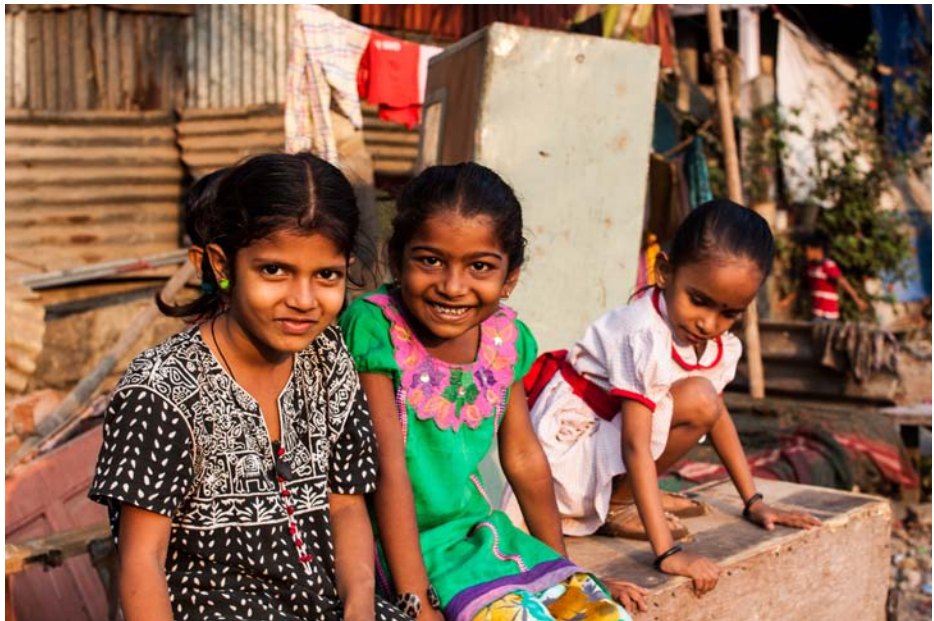
Los niños y la salud ambiental en la India.

Los datos recolectados con propósitos clínicos (por ejemplo, para diagnosticar enfermedades infecciosas, monitorear la resistencia microbiana o las ENT como la diabetes y dar seguimiento a un comportamiento asociado a la cardiopatía coronaria o la obesidad) pueden usarse para fines legítimos de vigilancia de la salud pública, a condición de que tal uso cumpla con los criterios establecidos en las pautas 1, 3, 4 y 7 a 14 de este documento. Este uso para un propósito distinto requiere la protección adecuada de la seguridad y confidencialidad de los datos (pauta 10).