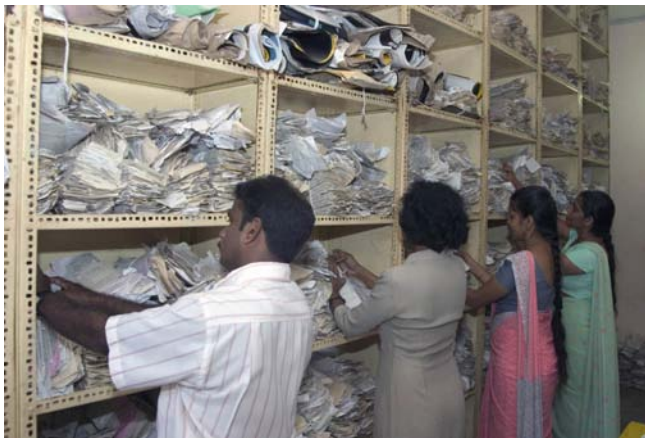
Personal de la oficina de expedientes médicos revisan historias de pacientes en el hospital Karapitayam, en Galle.

El imperativo de resguardar los datos no debería considerarse una licencia para negarse a usar o difundir información de vigilancia eficazmente con propósitos legítimos de salud pública (véanse las pautas 14 a 17 sobre compartir información y el análisis de la pauta 2 sobre una verdadera capacitación en ética).