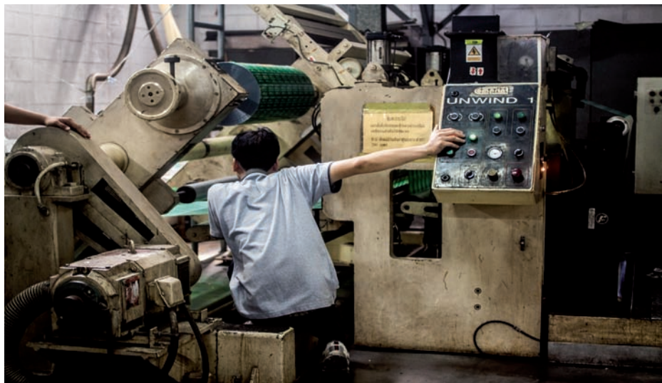
Fábrica de Kim Pai, Bangkok, junio del 2015.

Las siguientes pautas por consiguiente cubren (i) la amplia responsabilidad de emprender la vigilancia y someterla a escrutinio ético; (ii) la obligación de garantizar la protección apropiada y los derechos; y (iii) las consideraciones a la hora de tomar decisiones sobre cómo comunicar y compartir los datos de vigilancia. Estas pautas representan un punto de partida para iniciar y sostener la discusión que exige la vigilancia de la salud pública. Al igual que otras pautas internacionales sobre la ética de la investigación, la ética de la vigilancia requerirá de una evaluación y revisión continuas a la luz de la experiencia adquirida.