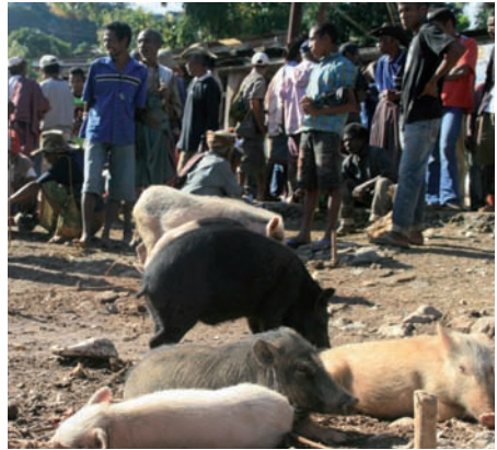
Vendedor de perros y cerdos un día de mercado en Atsabe, Ermera.

No ha de causar sorpresa la naturaleza de las orientaciones internacionales, fragmentada y específica para cada enfermedad, dado el estado desigual e incompleto de la vigilancia de la salud pública tanto en los entornos de bajos recursos como en aquellos de altos recursos y en los diferentes mandatos