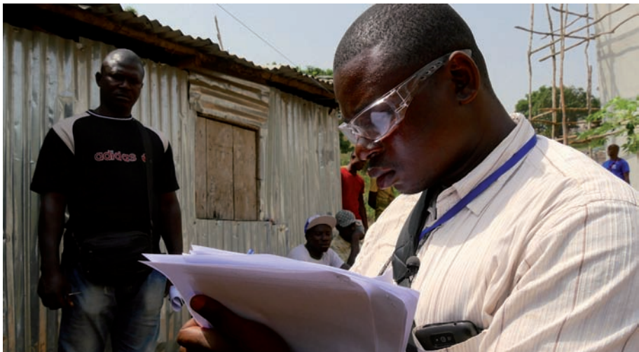
Un estudiante de medicina y un funcionario distrital de vigilancia investigan presuntos casos de Ébola en la región occidental de Sierra Leona.

Como parte de los preparativos continuos previos a una epidemia, los países deberían examinar sus leyes, políticas y prácticas sobre compartir datos para proteger de manera adecuada la confidencialidad de la información personal y responder a otras cuestiones éticas relevantes, como la resolución de controversias relativas a la propiedad o el control de los datos de vigilancia. Deben tomarse medidas para evitar que al compartir rápidamente información de vigilancia con implicaciones inmediatas para proteger la salud pública e impulsar el bien común se impida una posterior publicación en una revista científica (87).