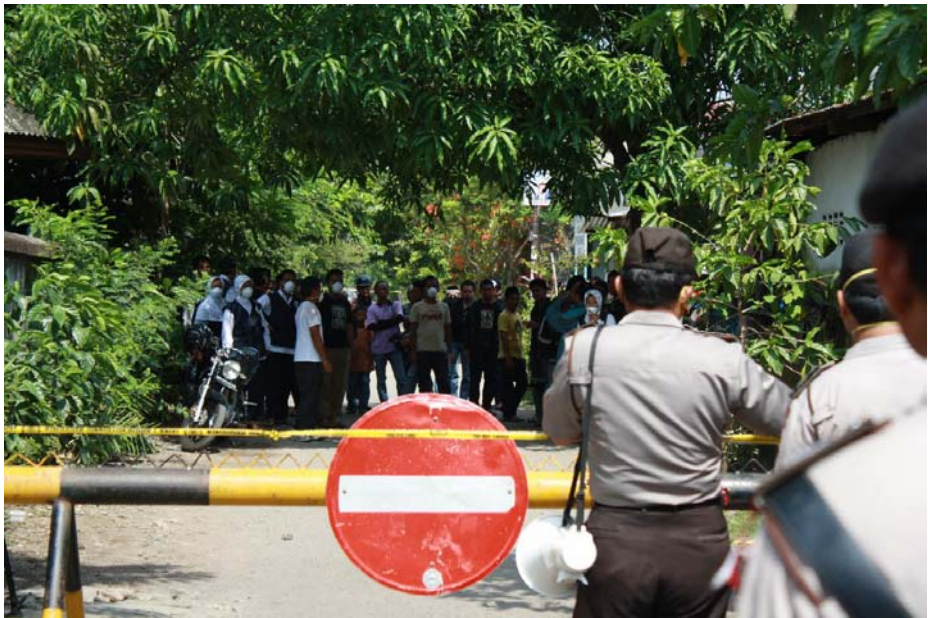
Ejercicio de contención de una pandemia (simulacro), a cargo del Ministerio de Indonesia con el apoyo de la OMS Indonesia.

La transparencia es esencial con respecto a: (i) los objetivos y la duración de cualquier actividad de vigilancia de la salud pública, (ii) la justificación de tal actividad en relación con metas explícitas para la salud o los sistemas sanitarios, (iii) los beneficios deseados y las cargas potenciales para los ciudadanos y otros actores de la vigilancia de la salud pública, (iv) el alcance y los métodos que han de usarse para la recolección de datos, (v) los usos