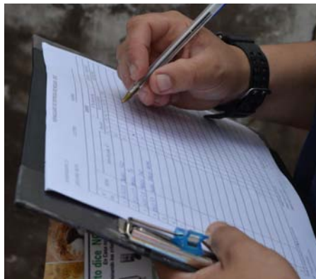
Trabajador de salud recoge datos y llena encuestas hechas a habitantes de Salto (Uruguay).

La definición de la vigilancia de la salud pública difiere considerablemente de un país a otro. Aunque la vigilancia se describe generalmente como sistemática o continua, no todos los países, instituciones o expertos señalan la naturaleza sistemática de la vigilancia de la salud pública, sino que en su lugar enfatizan la finalidad y función de la recolección de datos (véase el cuadro 1). Asimismo, si bien las enfermedades y los traumatismos siempre figuran de forma destacada, algunas definiciones incluyen determinantes de eventos de salud pública importantes (10) y condiciones ambientales que afectan la salud (11).