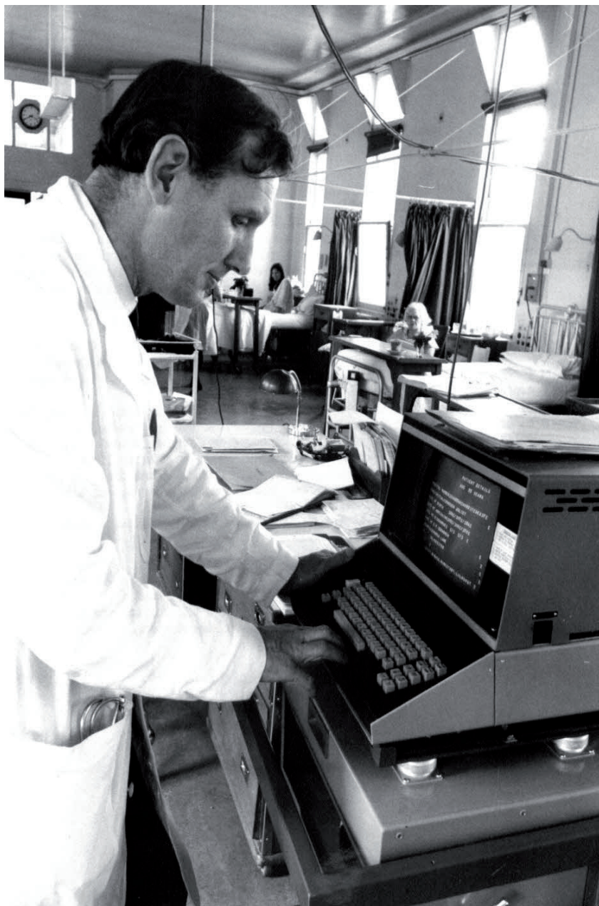
Computadora de cabecera en la sala de diabéticos del King's Hospital, Londres, años setenta.