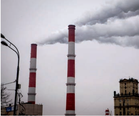
Contaminación industrial. Moscú (Rusia).