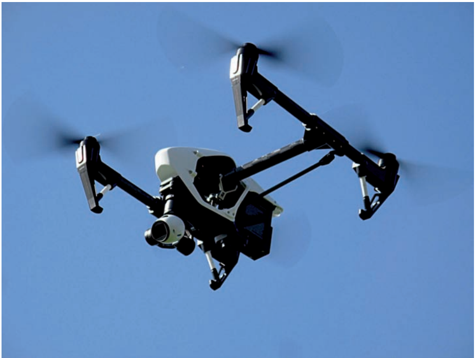
Dron en cielo despejado. Robert Lynch.

Cuando la recolección de nombres o identificadores únicos se considere un imperativo, este requerimiento debería indicarse explícitamente durante la planificación del programa. Los países no solo emitirán juicios diferentes, sino que además los requerimientos de nombres probablemente no sean uniformes entre ellos. Puede que los datos personales se requieran únicamente a nivel local y baste con tener datos anónimos o agregados a nivel nacional o mundial.