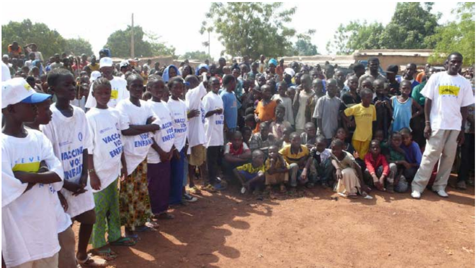
Público asistente a un evento comunitario con motivo del inicio de una campaña de vacunación.

efecto, alguna clase de pauta formal o supervisión continua? Hacer la distinción entre investigación y vigilancia —o entre investigación y otras formas de exploración social básica como el mejoramiento de la calidad, la investigación sobre la implementación, la historia oral o incluso el periodismo— ha resultado ser todo un reto, pero hasta la fecha, las soluciones basadas en definiciones han sido inadecuadas (38, 39). En consecuencia, un grupo importante de expertos en vigilancia destacó la necesidad de “olvidarse de la demarcación formal entre investigación y práctica” (29). Estas pautas buscan hacer eso, no al elaborar nuevas definiciones sino al poner en relieve tanto la importancia de la vigilancia de la salud pública para el bienestar de la población como la necesidad de contar con una orientación y una revisión éticas apropiadas; en otras palabras, la necesidad de contar con un paradigma de rendición de cuentas que responda a las demandas de salud pública y que se diferencie de los sistemas que han regido la investigación durante medio siglo.