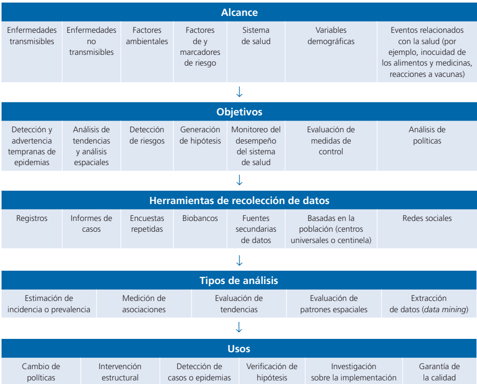
Cuadro 1. Dimensiones de la vigilancia de la salud pública

transmisibles, que es cada vez mayor. Al contribuir a determinar los patrones y las causas de la morbilidad y la mortalidad, puede ayudar a garantizar el acceso a alimentos inocuos, agua limpia, aire puro y ambientes saludables. Una vigilancia ambiental continua permite no solo detectar preocupaciones sino también activar alertas. La vigilancia de enfermedades ocupacionales puede identificar las exposiciones en el trabajo y propiciar la adopción de normas. La vigilancia puede ayudar a crear instituciones responsables al suministrar información acerca de la salud y sus determinantes. Puede proporcionar los datos científicos necesarios para establecer y evaluar las políticas de salud pública. La vigilancia, por ejemplo, será